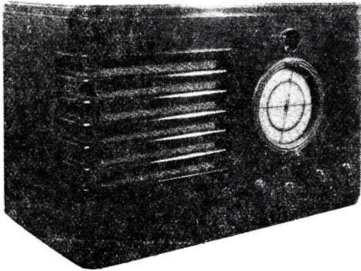
第1圖 外 観

デリカ・オールウェーブ・スーパーには通信用と放送受信用の2種類があつて、更にそれ等が数種類に分れて居りますが、こゝには8球式の電話用のオールウェーブ・スーパーのみに就てその構造を述べて見ます。