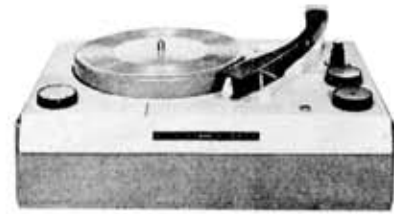
第6図 ステレオレコードプレーヤ「R-071」