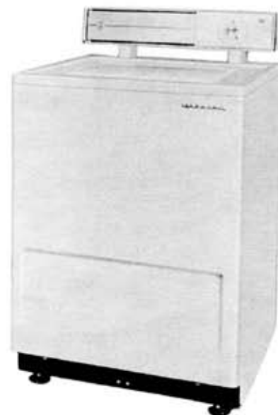
第9図 SC-AT 1 形全自動洗濯機