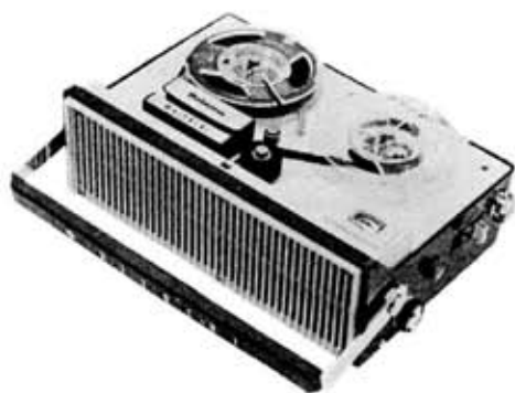
第20回 日立テープレコーダー“ベルゾーナ300”