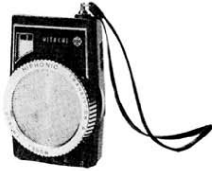
第21図 6石ポケットラジオ“ハイフオニック TH-600”

このセットは、トランジスタ6石のほか、ダイオード2石、サーミスタ1石を付加した高級回路構成になっており、特に従来のポケットラジオの感覚を一新した“カメラスタイル”は、ハイフォニックのすぐれた性能を更けるに十分な斬新なデザインである。