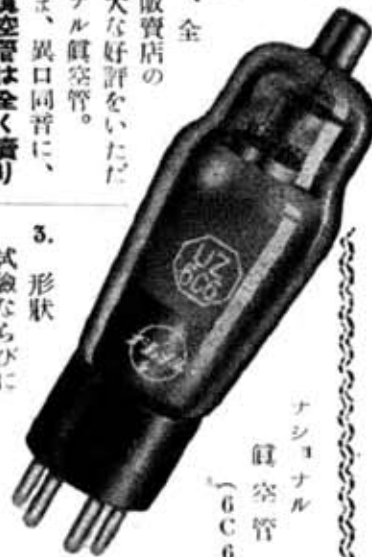
ナショナル 真空管 (6C6)

改良に改良を 加え、今日では 名實ともに、優 秀真空管として、全 國津々浦々の御販賣店の 皆さまより、絶大な好評をいた だしているナショナル真空管。 昨今では皆さま、異口同音に、 『ナショナル真空管は全く賣り よくなった。品質の優秀性は絶対 だ』 と、いう聲が、他メーカー製品を 壓して大きく聞かれます。 これは、たゆまざる品質改良の 結果であり、絶対に品質を保証す るナショナル真空管の眞實の姿で あります。