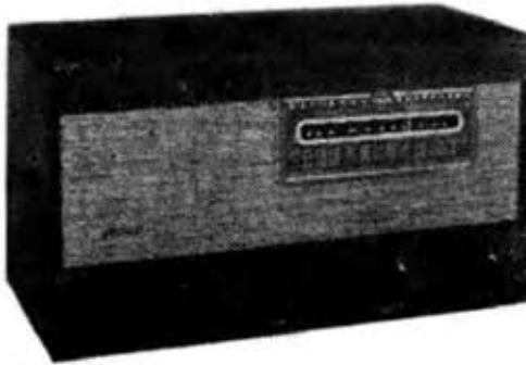
ナショナル5球スーパー (US-100L)