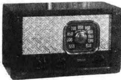
ナショナル5球スーパー (5S-19G型)

すでに、皆 さま、よく御 存知のように ナショナルラ ジオは、民間 放送開始によ るスーパー時 代にそなえ、 廣く、いかな る階層の人々 にでも、買い やすい、安値 な、しかもス