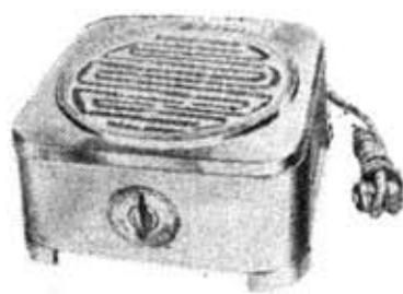
ナショナル高級コンロ (1.2KW)

絶讃を博しております、ナショ ナル高級一・二KWコンロの、ス イッチについては皆さまより種々 の御意見や御指示をいただきお りましたが、弊社では、これにつ いて鋭意研究、検討を加え、こん ど、従来のバーキンスイッチの長 所に、ロータリー式の長所を加味 した壽命の長い、堅牢無比なバ ーキンスイッチに改良し、十一月 二十一日より出荷しております。 最要期をむかえました今日、