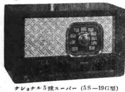
ナショナル5球スーパー (5S—19G型)

と、同時に、原格ラインからも一、二機種に生産を集中せず、民間放送開始目前にひかえ、これからのラジオがスーパー級に流行してゆくことは明らかであります