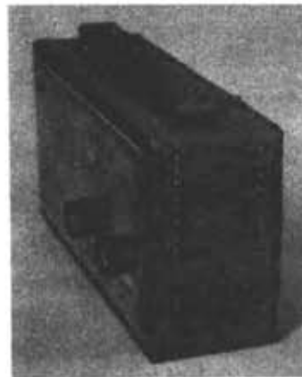
トーン切り替えスイッチ

ローカル放送や、ハイファイ音楽の時は「H」で、雑音の影響の多い遠距離放送の時や、ムードミュージックの時は「L」でと、お好みの音質で聞けるトーンスイッチ付きです。