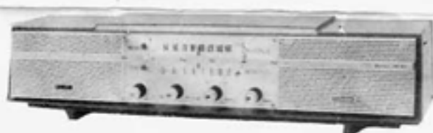
5球2スピーカーラジオ