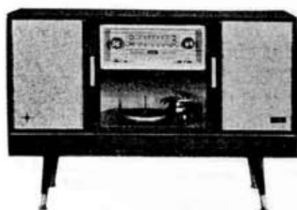
Toshiba Family Stereo Series, FS-8500

付属回路等 ダイナミックコントロール 残響装置 SEC方式 ラウドネスコントロール レコードケース 録音端子 (ステレオ) FMステレオアダプタ端子