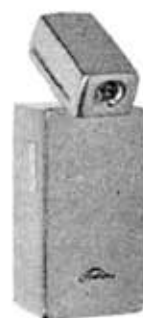
Pocket light "Stainless" LRP-203