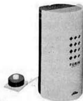
"Furin" buzzer, LSB-102