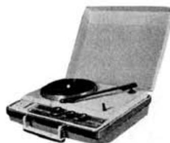
Portable phonograph GP-19 M