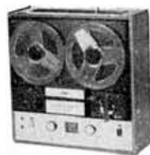
Tape recorder, PT-820S, "Stereo Deck"