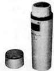
Dry battery shaver, BS-11L, "Sol-Smile"