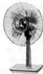
Electric fan