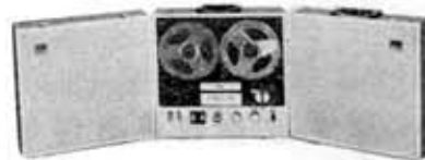
Tape recorder, GT-810S, "Stereo Ace"