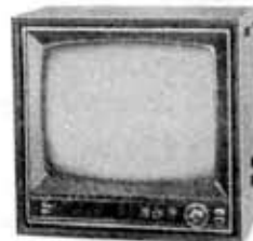
Television receiver, 19HB, "Highness 19"