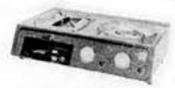
Gas range, KR-250

Toshiba merchandise selected as "Good Design"