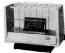
Gas stove, GSN-210