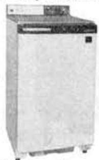
Electric refrigerator, GR-90DM