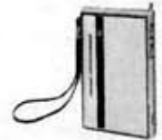
Transistorized, radio, 8M-823F