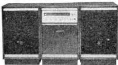
Stereo phonograph, MS-40, "London"