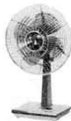
Electric fan, TM