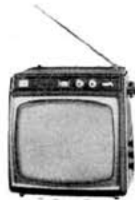
Television receiver, 11TC