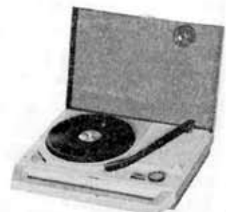
Transistorized portable phonograph, GP-55

針 圧 4g (3) 総合 電源 100V 50/60 c/s 110W 外形寸法 幅 130×奥行 39×高さ 42.5 (cm) (脚 26cm) 重量 30kg 現金定価 FS-5500MA (オートプレーヤ付) 67,300円 FS-5500MC (オートチェンジャ付) 71,800円 (音響事業部)