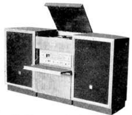
All silicon transistorized separate type stereophonograph, MS-30T, "Berlin"

ターンテーブル 15cm ゴムカバー付 カートリッジ 高出力セラミック 針 長寿命レコード針「ウルトラC」 電源 UM-1×4 6V または ACアダプタ 外形寸法 幅 29.5×奥行 25×高さ 7 (cm) 重量 2kg 現金定価 5,850円 (乾電池とも) (音響事業部)