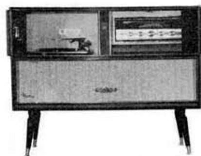
Stereophonograph "Paris" Type FS-4500

受信周波数 MW 530~1,605 kc FW 76~90 Mc 真空管 8球4ダイオード スピーカー 20cm × 2 6cm × 2 外部端子 ステレオヘッドホン端子 FM マルチアダプタ接続端子 出力 最大 10W 再生周波数 30~10,000 c/s 外形寸法 980 (幅) × 392 (奥行) × 547 (高さ), 289 (足) mm 重量 27kg + 3kg (プレーヤ) (2) プレーヤ部 形式 4スピード、オートチェンジャ