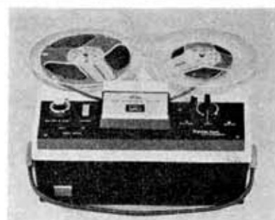
New tape recorder "Family Ace", Type GT-720

スピーカー ダイナミックスピーカー 10×15cm 出力 1.5W トランジスタ 8石ほかにサーミスタ 1石 ダイオード 2石 録音レベル監視 レベルメータ (オートレベル方式の場合は不要) 電源 交流 100V, 50% または 60% 消費電力 50W 入力ジャック マイク 1 補助入力 1 出力ジャック 外部スピーカー 1 モニタ 1 寸法 331 (幅) × 167 (高さ) × 310 (奥行) mm 重量 6.2 kg 付属品 ダイナミックマイク、ロホン