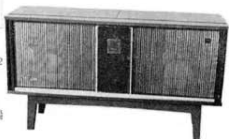
Console type stereophonograph, "Oslo", FS-7700M

真空管 12球8ダイオード スピーカ 20cm×2,ホーン(8cm)×2 出力 最大 30W (2チャンネル) 外部端子 ステレオヘッドホン端子, 録音端子, FM アンテナ端子 プレーヤ TPS-320オートチェンジ スピード 4スピード 電動機 四極誘導電動機 ターンテーブル 20cmゴムシート付 カートリッジ ハイコンプライアンスカー トリッジ 針 長寿命レコード針「ウルトラC」 針 庄 4g 電源 100V, 50/60c/s,