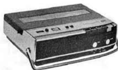
Tape recorder "Handy Ace De Luxe" GP-611P