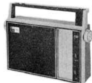
Transistor radio, 11L-805FS "GT-FM De Luxe"

仕様 方式 11石3バンド、スーパーヘテロダイ ン 受信周波数 AM 530~1,600 kc SW 6~18 Mc FM 76~90 Mc 電源 UM-2 (単二)×4 6V スピーカ 9.2cm パーマネントダイナミ ック形 出力 700mW (最大) アンテナ フェライトコア アンテナ ジャック イヤホンジャック、外部電源ジ ャック 各1個