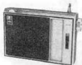
Transistorized radio, 8M-390S