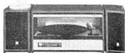
Separate FM-AM stereophonograph FS-2000F, "Napoli"