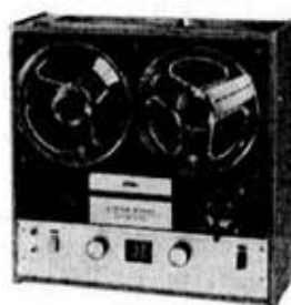
図 2. PT-820S