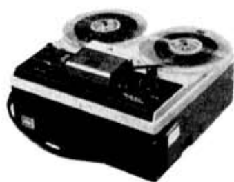
図 1. GT-720