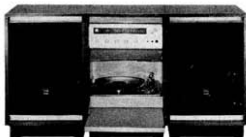
図 7. MS-40