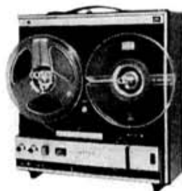
図 4. GT-701V