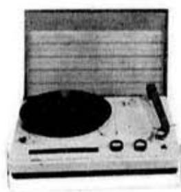
図 5. GP-17R