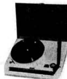
図 6. GP-55