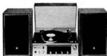
Separate type table stereophonograph, "Sofia Deluxe", FS-2600 M

イヤル、ステレオテープ録音再生端子 (DIN 規格) 等の新たな採用に加え、30 cm の大形