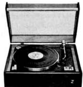
Stereo record player, SR-10A

寸 法 幅470×高さ180×奥行360mm 重 量 11kg 現金定価 32,000円