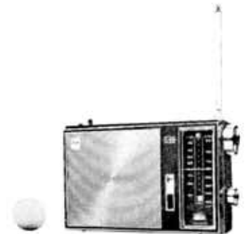
Transistor radio, 12 M-860 FD

付属品 キャリインダケース、イヤホン、乾電池 UM-2×3 現金定価 12,900円