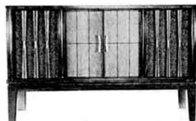
Console type stereophonograph "Wien" FS-6400 MA, FS-6400 MC

出力 ミュージックパワー 35 W 外部端子 ヘッドホン端子、録音再生端子 (DIN 規格) プレーヤ (FS-6400 MA) 形名 TPS-730 (オートプレーヤ) スピード 2スピード 電動機 四極誘導電動機 ターンテーブル 28 cm カートリッジ レコード針「ウルトラ C」付セラミック 針 庄 4g 電源 AC 100V 50/60 c/s プレーヤ FS-6400 MC 形名 TPS-520 (オートチェンジャ) スピード 4スピード 電動機 四極誘導電動機 ターンテーブル 28 cm カートリッジ レコード針「ウルトラ C」シリコン付