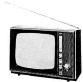
Television receiver, 12PX