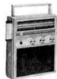
Play tape set, KT-11 RP