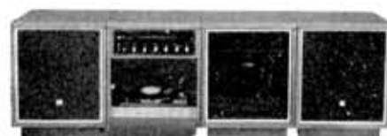
Separate type stereophonograph "Boston Interia", SP-780 P