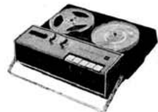
Portable tape recorder "Collage Ace" GT-621 P