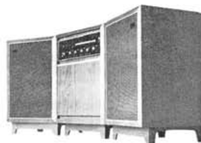
Separate type stereophonograph "Boston Special" SP-300P