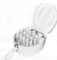
"My Set Carler" HDS-315